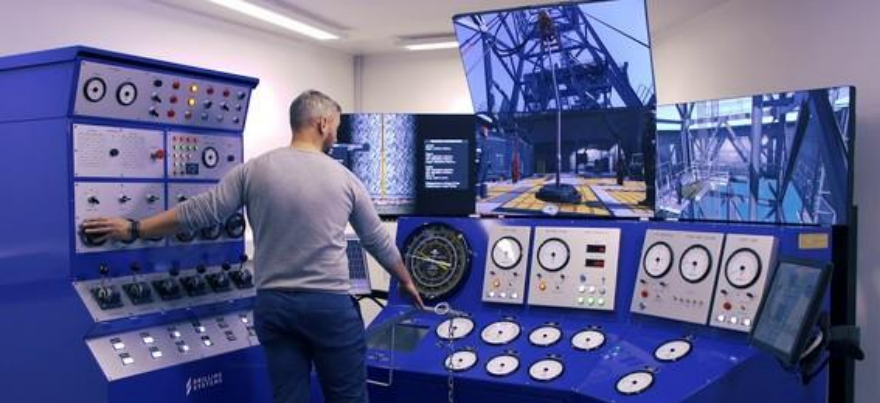
Well Control Courses