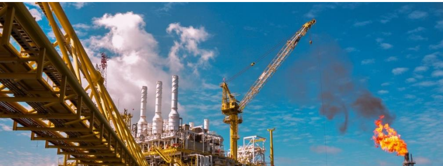
Drilling and Completion Courses