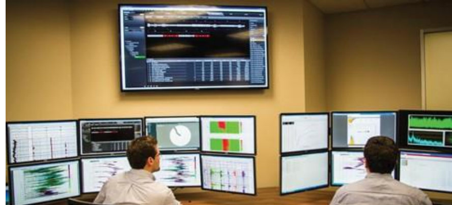
Exploration and Geoscience Courses